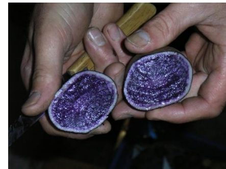
Svartpotet fra Vegårshei