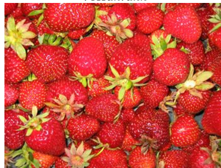
Gamle norske jordbær