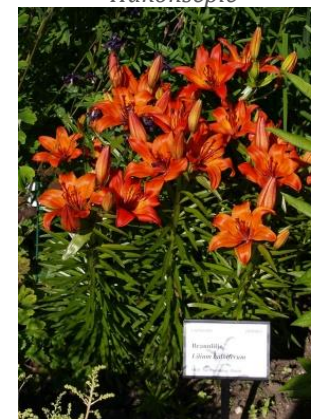
Brannlilje fra Gamlemorshage på Ringve i Trondheim