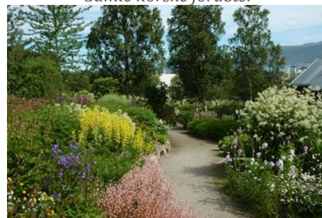
Tradisjonshagen i Tromsø: spennende stauder fra Nord Norge